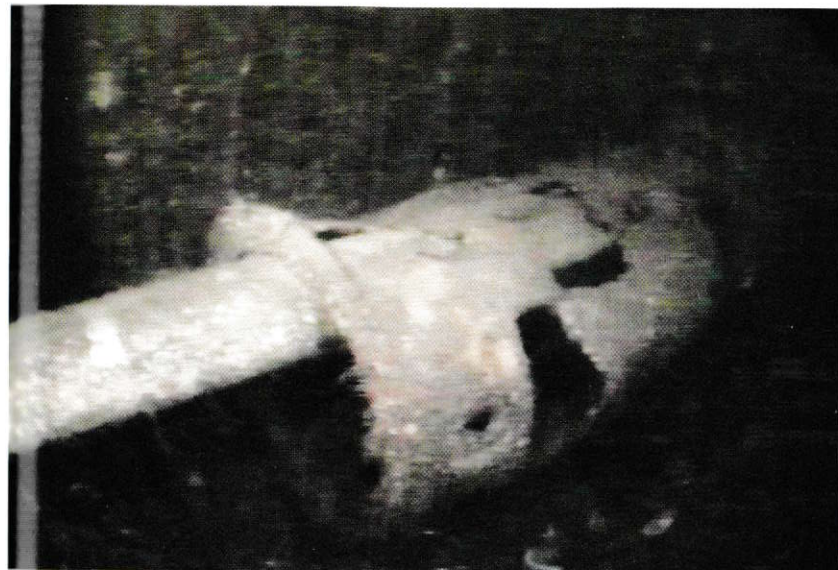
Periscopul submarinului, care zace pe fundul oceanului lângă epavă.