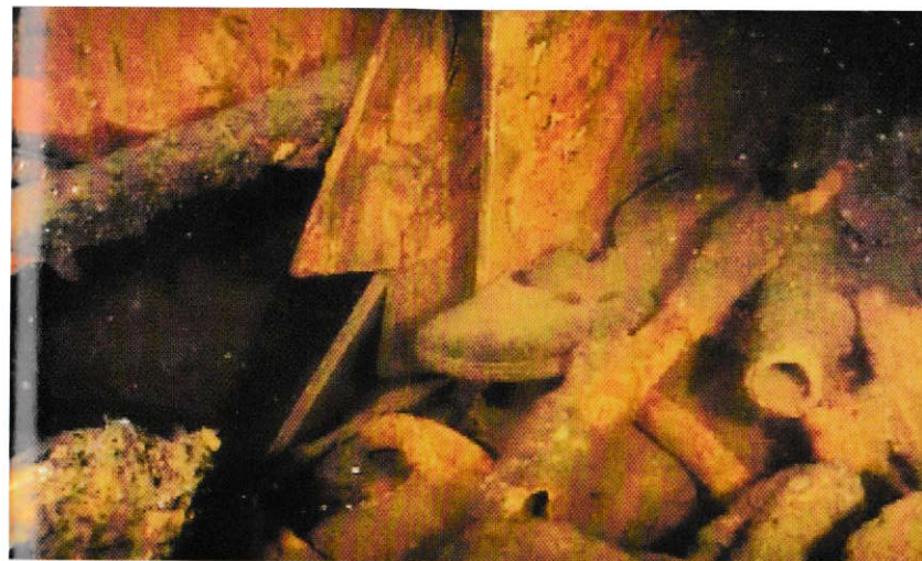
Un pantof cu talpă de cauciuc, aflat printre dărămăturile din cabinele ofițerilor. Membrii echipajului purtau pantofi moi în timpul atacurilor pentru a nu produce niciun sunet.